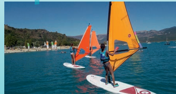
planche à voile